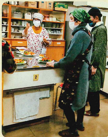
エンジョイクッキング